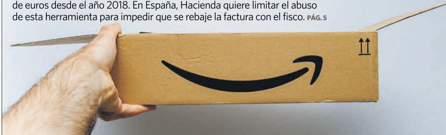
Amazon tiene su sede europea en Luxemburgo.

La compañía acumula pérdidas en el 'holding' europeo por 6.700 millones de euros desde el año 2018. En España, Hacienda quiere limitar el abuso de esta herramienta para impedir que se rebaje la factura con el fisco. PÁG. 5