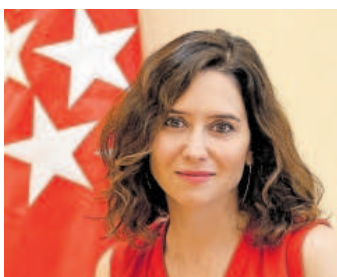
Isabel Díaz Ayuso.

Alcance. Avanza a la CNMV que “no tiene intención de adquirir el control o una participación mayoritaria” —P3