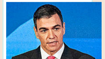
Pedro Sánchez, ayer.

Sánchez promete ir a por más fondos europeos