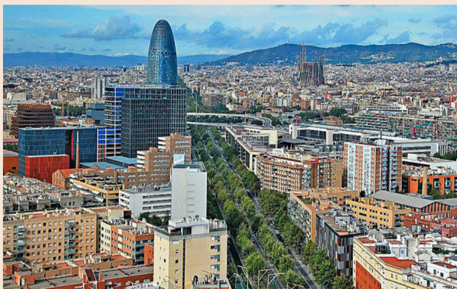
Barcelona es una de las ciudades donde más suben los alquileres con un alza del 12,4% en 2023.

La compraventa de viviendas acumula 14 meses seguidos de caídas P23