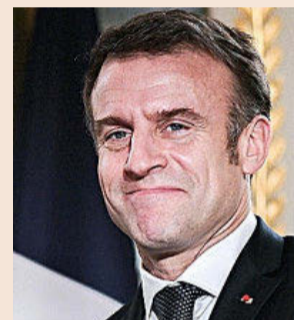
Emmanuel Macron, presidente de Francia.