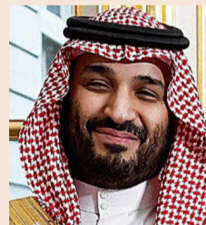
Mohamed bin Salmán, primer ministro de Arabia Saudí.