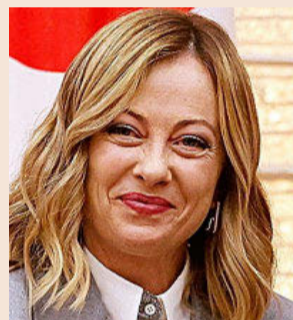
Giorgia Meloni, primera ministra de Italia.