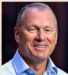
Nicolai Tangen, consejero delegado de Norges Bank.

■ Qatar participa en Iberdrola (6,3%), IAG (25,4%) y Colonial (19%)