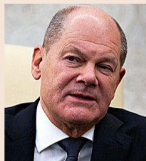
Olaf Scholz, canciller de Alemania.