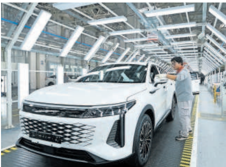
Línea de producción en una planta de Chery.

Planes. Cierra su llegada a Barcelona y montará vehículos completos, entre ellos, el Omoda 5 eléctrico