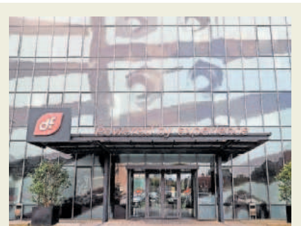
Sede de Duro Felguera.

Estrategia. Se ubicará en la antigua factoría de Nissan, zona en vías de reindustrialización —P3