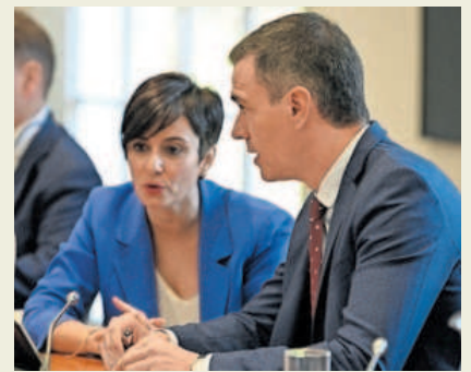
El presidente del Gobierno, Pedro Sánchez, y la ministra de Vivienda, Isabel Rodríguez.

Bolsa. El Ibex baja más del 1% ante el temor a que la Fed no baje tipos en 2024 —P15-16. Editorial P2