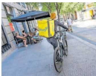
Un repartidor de Glovo.

Sabadell se dispara en Bolsa tras elevar un 50% el beneficio, hasta 308 millones —P4