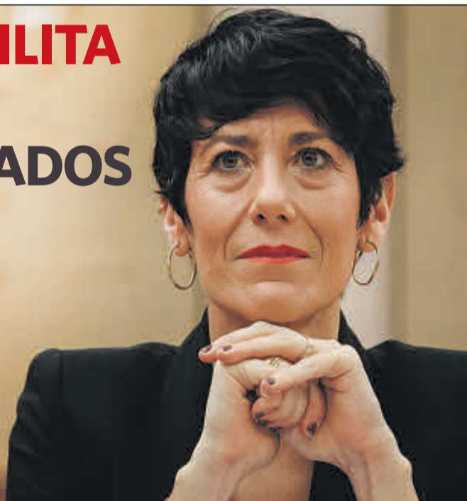
La ministra de Inclusión, Seguridad Social y Migraciones, Elma Saiz.

Reduce el sueldo mínimo que da derecho al permiso de residencia de estos trabajadores de 39.000 a 36.250 euros. En puestos de difícil ocupación, ese sueldo baja a 29.000. PÁG. 26