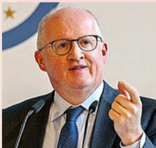
Philip Lane, economista jefe del Banco Central Europeo.

McDonald's planta cara a Burger King con 200 aperturas P6